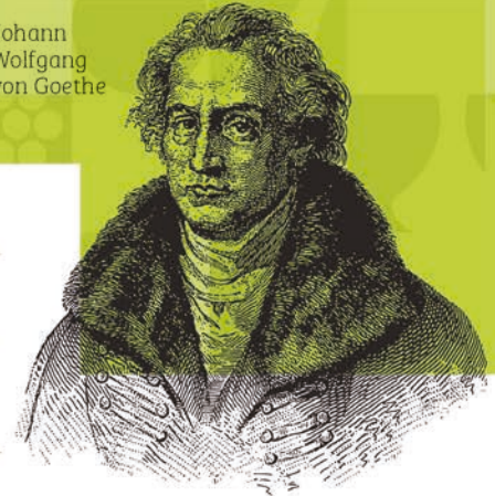
Johann Wolfgang von Goethe

Uma verdadeira viagem entre países com momentos de glórias, resistência e valorização. Da criação nos Estados Unidos à homenagem a um famoso alemão, a uva Goethe ultrapassa mais fronteiras até ser propagada pela imigração italiana para uma nova vida no sul do Brasil.