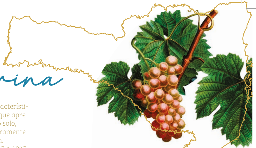
Perfil Topográfico Mapa dos Ventos

Desde 2012, os vinhos feitos com a uva Goethe são reconhecidos oficialmente pela tipicidade, identidade e qualidade através da conquista da Indicação de Procedência Vales da Uva Goethe, a primeira do Estado de Santa Catarina. O selo aplicado nos produtos é uma garantia ao consumidor e comprova que o vinho é genuíno com qualidades particulares ligadas à sua origem.